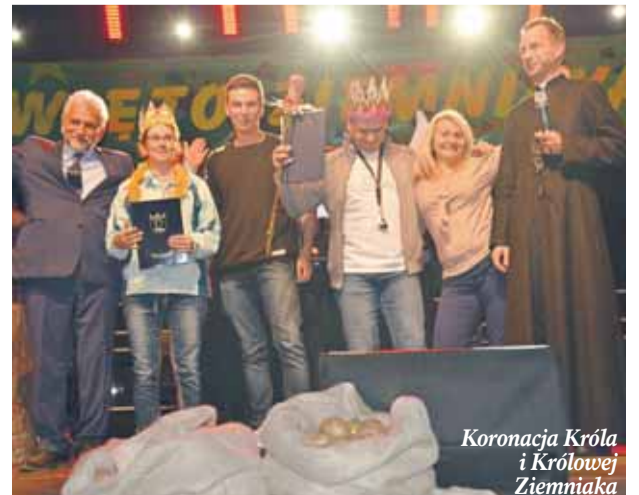
Koronacja Króla i Królowej Ziemiaka