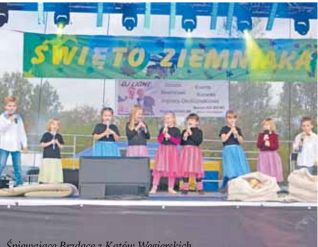
Śpiewające Brzdące z Kątów Węgierskich