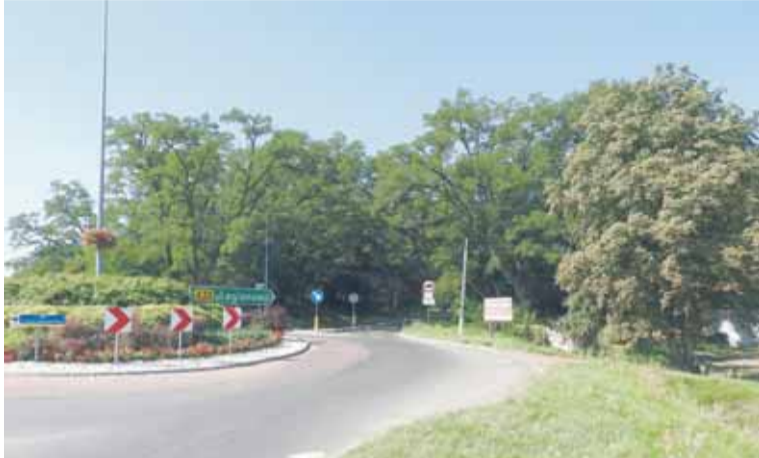
Widok na teren dawnego cmentarza w Józefowie.