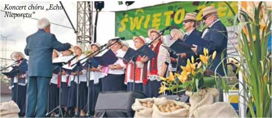
Koncert chóru „Echo Nieporętu”