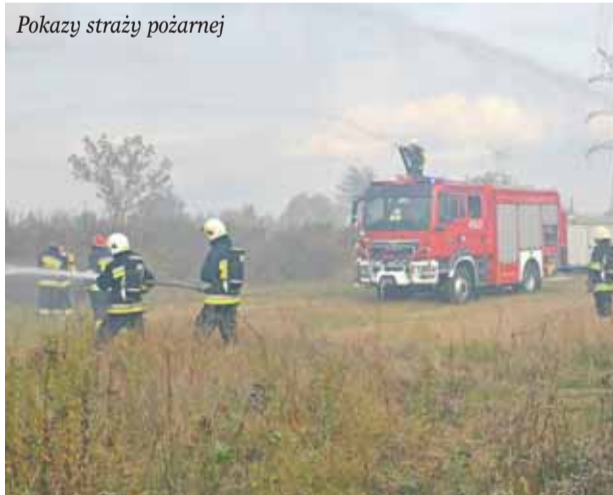
Pokazy straży pożarnej