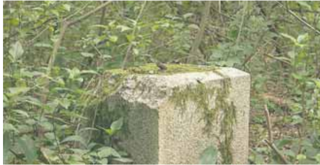
Nagrobek na cmentarzu w Stanisławowie Pierwszym