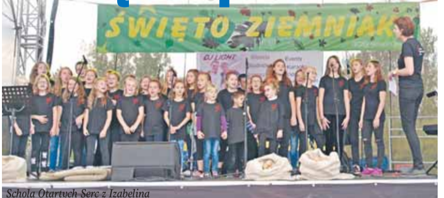
Schola Otartych Serc z Izabelina