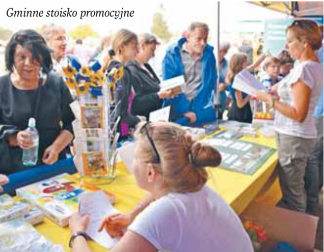
Gminne stoisko promocyjne