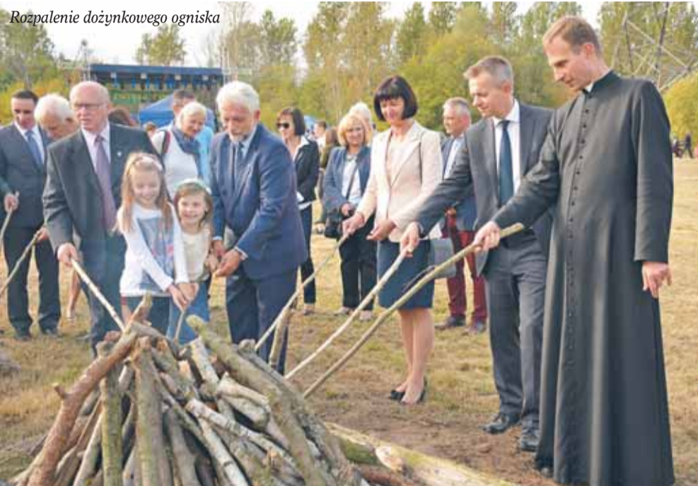
Rozpalenie dożynkowego ogniska