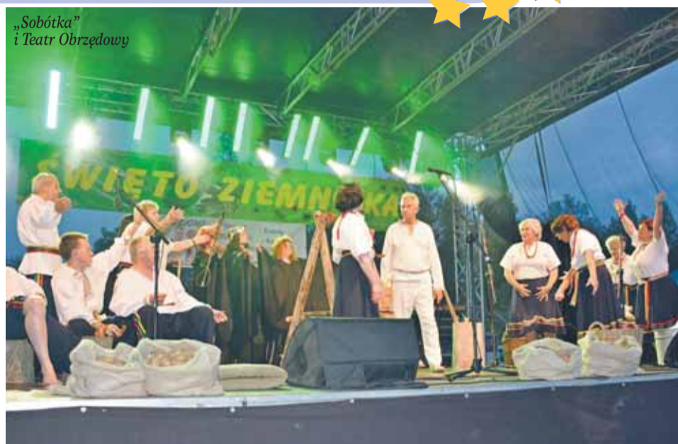
„Sobótka” i Teatr Obrzędowy

Piękna słoneczna pogoda z rekordowo wysoką temperaturą zapewniła tegorocznemu „Świętu Ziemiaka” wspaniałą oprawę i sprawiła, że mieszkańcy i turyści bawili się w Stanisławowie Pierwszym do późnego wieczoru.