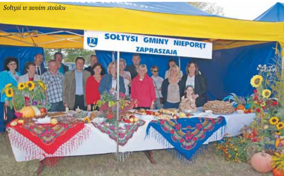
Sołtysi w swoim stoisku