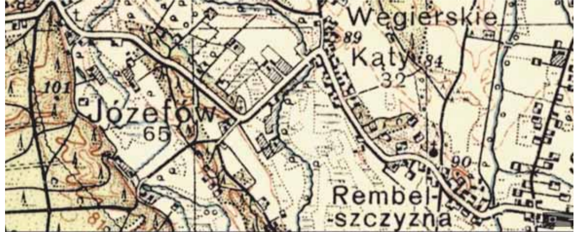
Fragment przedwojennej mapy Wojskowego Instytutu Geograficznego. Widoczny cmentarz w Józefowie.