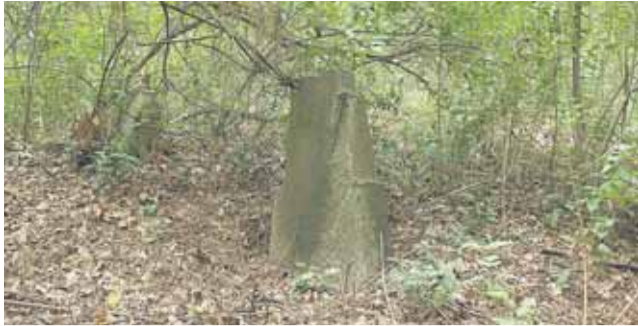
Granitowa stela nagrobna na cmentarzu w Stanisławowie Pierwszym