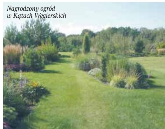
Nagrodzony ogród w Kątach Węgierskich

Konkurs na najładniejszy ogród przydomowy w 2016 roku rozstrzygnięty!