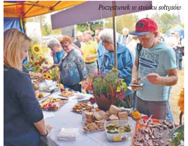
Poczystunek w stoisku sołtysów