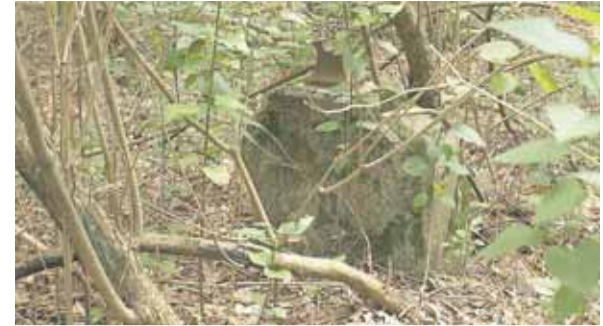
Nagrobek z motywem serca gorejącego w Stanisławowie Pierwszym