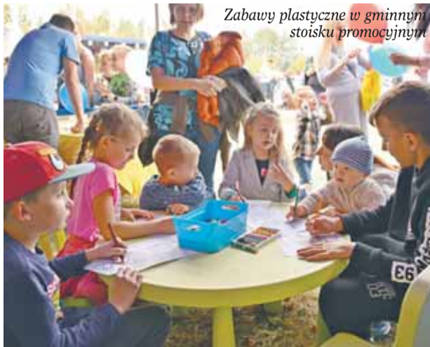
Zabawy plastyczne w gminnym stoisku promocyjnym