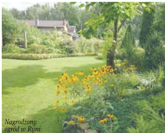
Nagrodzony ogród w Rygni